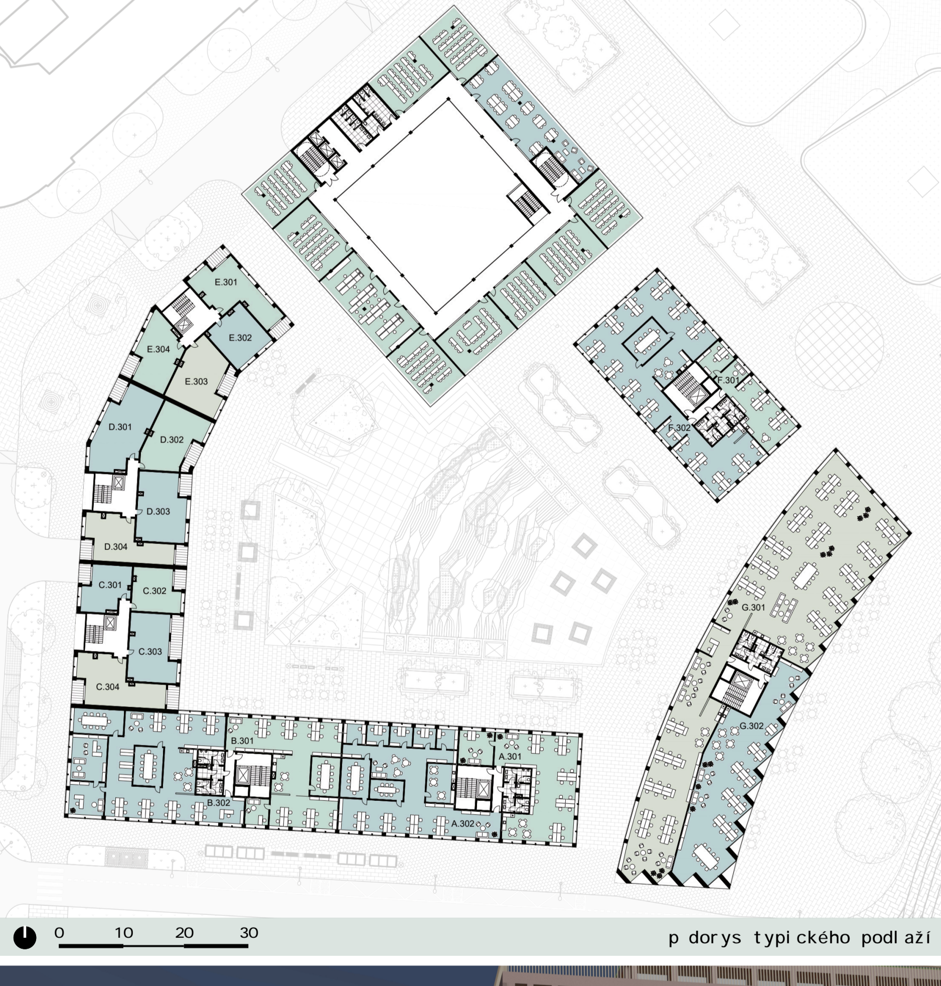
p. dorýs typického podlaží