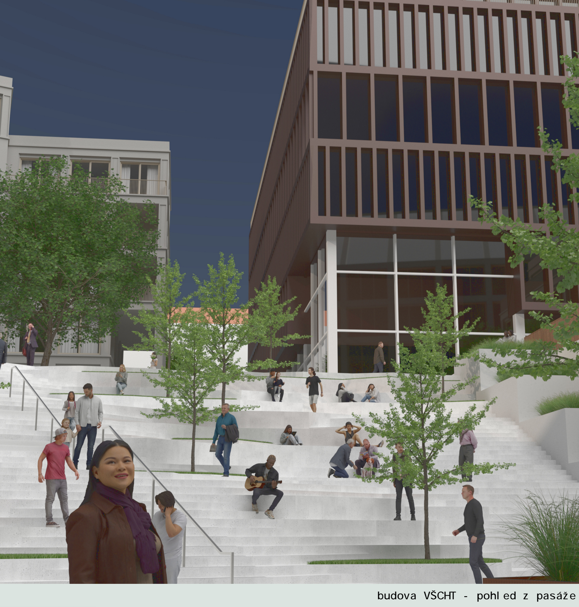
budova VŠCHT - pohled z pasáže