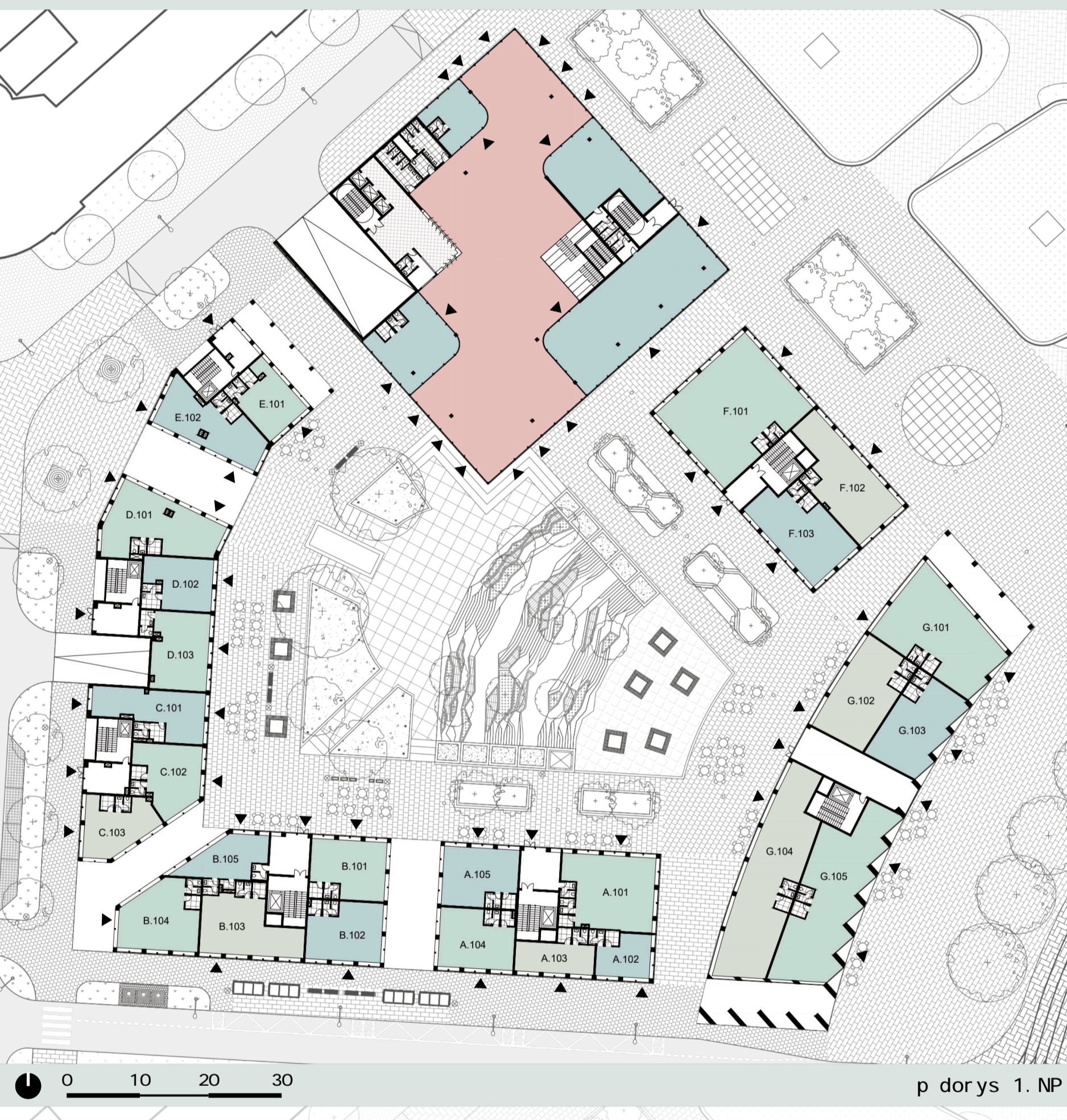
p. dorýs 1. NP