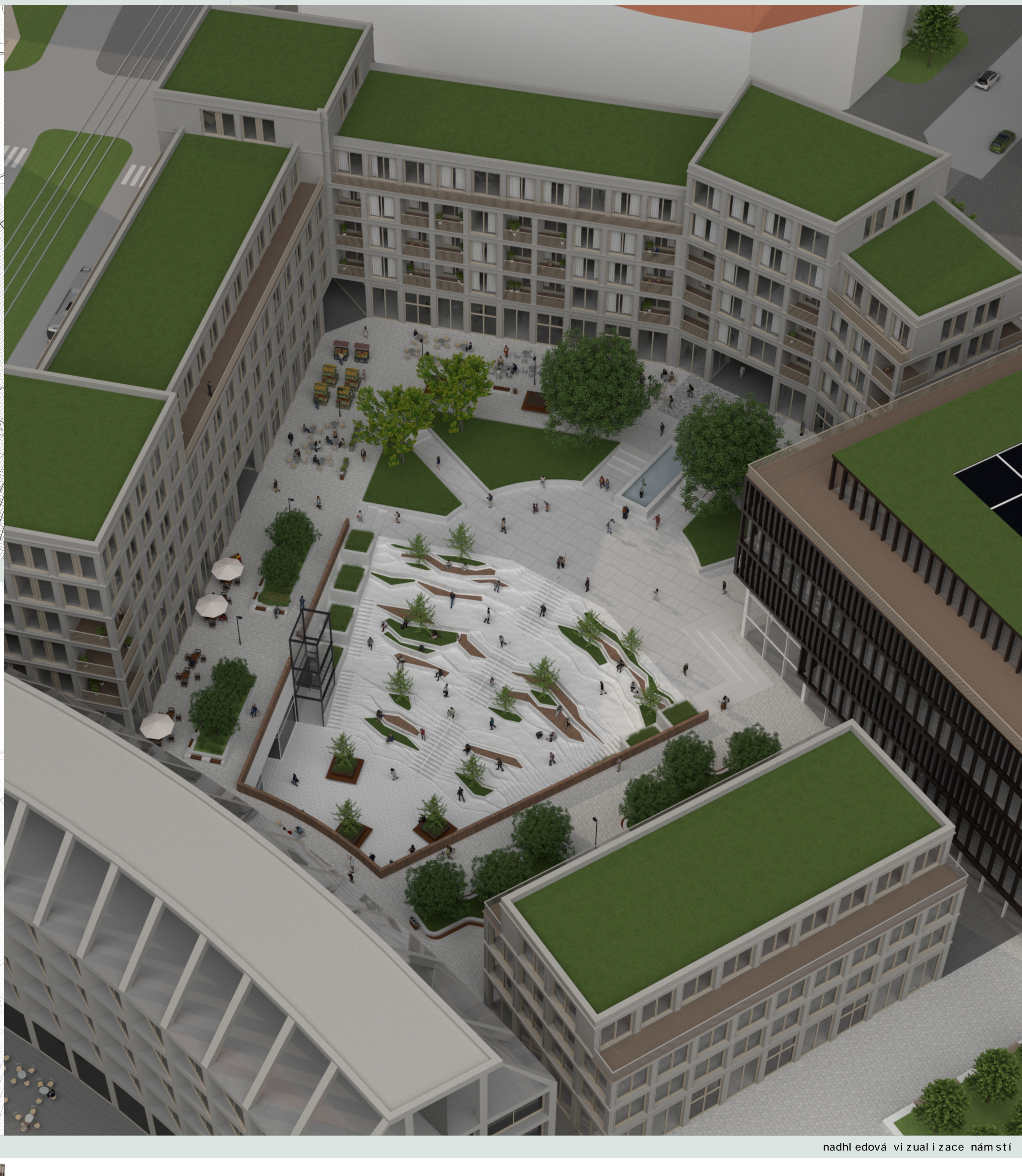
nadhledová vizualizace náměstí