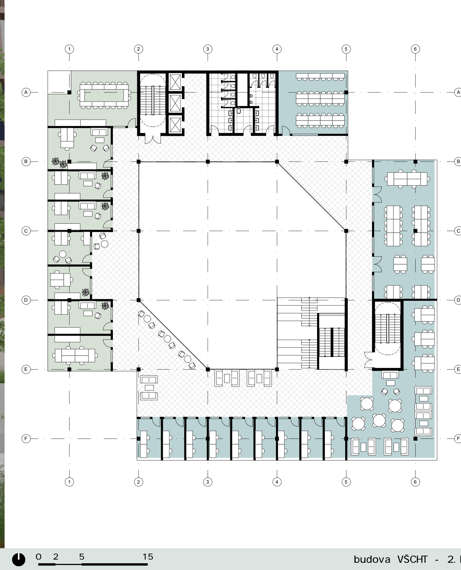
budova VŠCHT - 2. NP