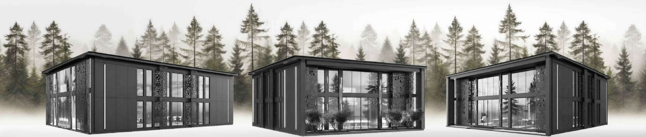
3D вигляд будівлі