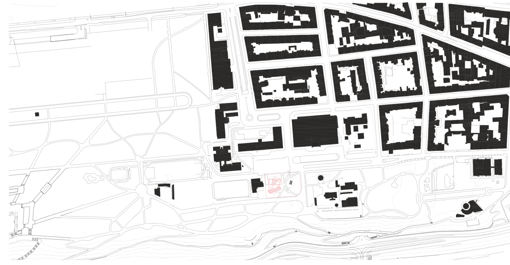
SITUACE ŠIRŠÍCH VZTAHŮ

Provoz a dispozice Třípodlažní prostorové uspořádání objektu je navrženo s důrazem na volný a plynulý pohyb návštěvníků. Transparentní a otevřený parter zve kolemjdoucí dovnitř a tvoří přirozený filtr mezi mlatoými cestami Letenského pláně a světem umění. Vyšší patra pak nabízejí soustředěnější a intimnější prostory nejen pro stálé expozice, ale i pro výzkumnou a edukační činnost samotné nadace. Kompletní komplex tak slouží nejen jako úložiště umění, ale jako živý kulturní bod celého území.