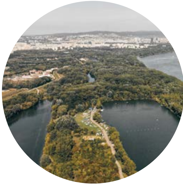
Prírodné prostredie POKOJ