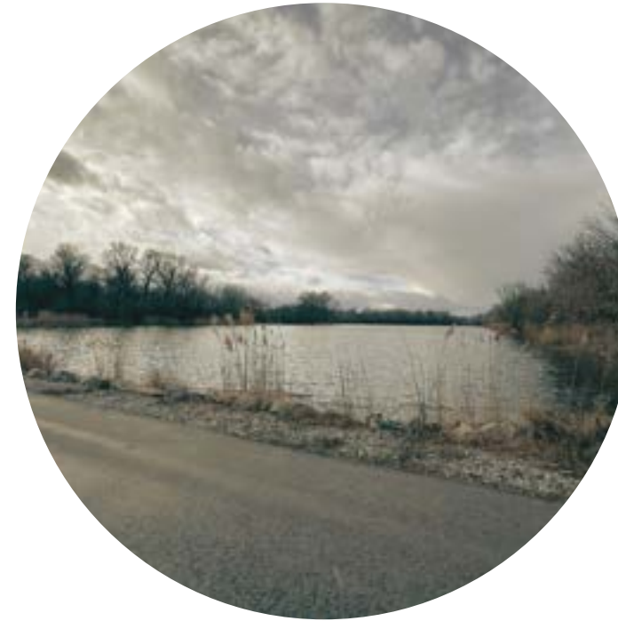
Sezónnosť -> Celoročnosť ŠPORTOVÝ KOMPLEX