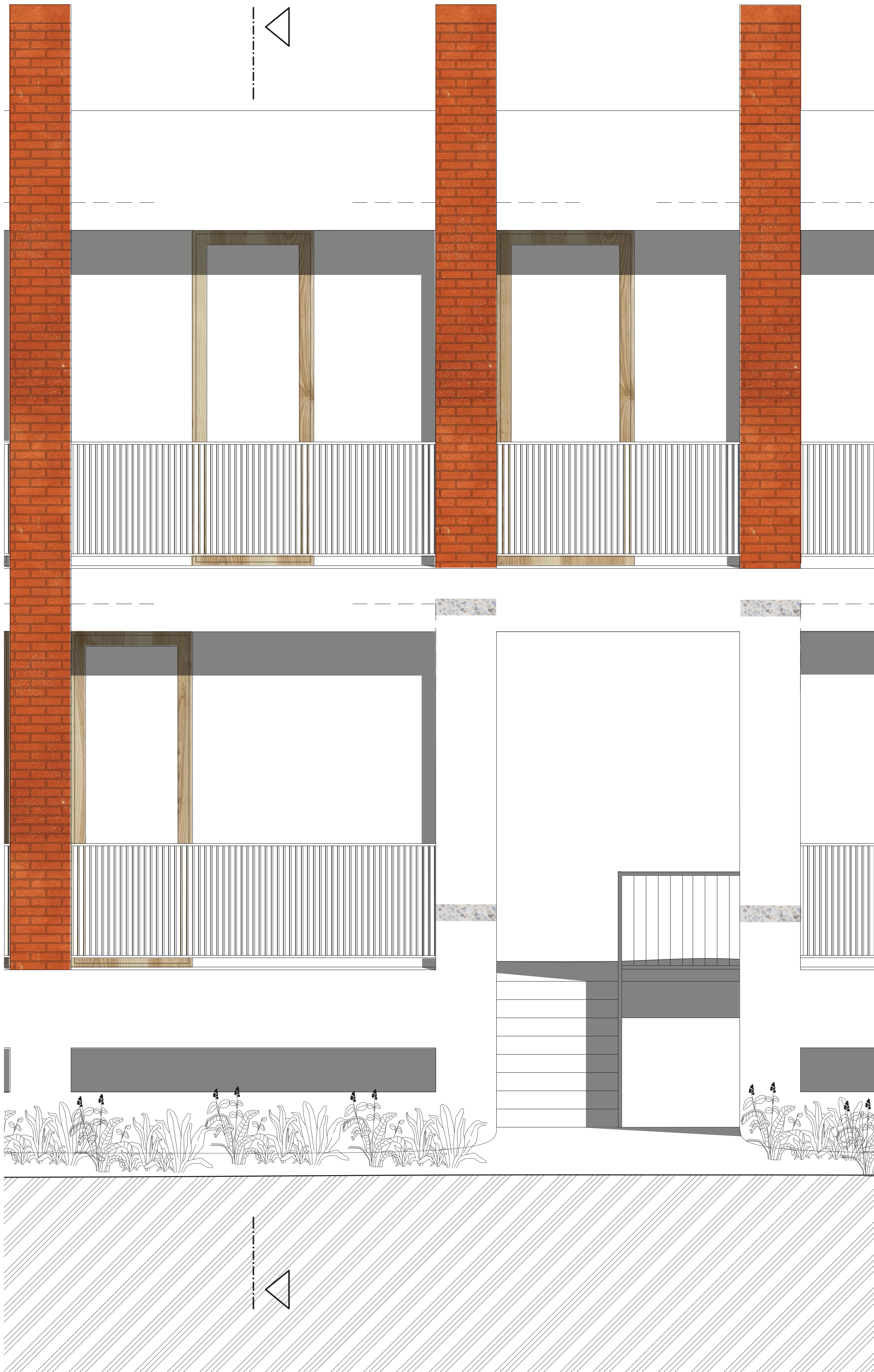
POHLAD NA VÝREZ FASÁDY | 1:20