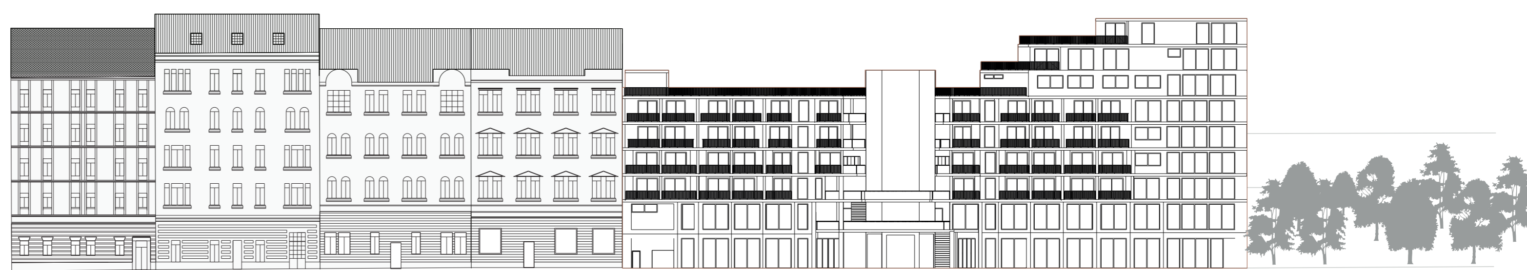
ortopohled- ulice Pernerova

Centrálním vizuálním prvkem je pak vertikální komunikace umístěná na ose protilehlé ulice. Jako zelený most roste vzhůru a propojuje tak ideově i vizuálně porostlé vitkovské stráně s industriálním Karlínem. Doplní ho zužující se pavlače, sloužící jak pro potřeby obyvatel a podporu sousedských vztahů, tak i pro veřejnost.